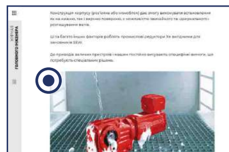
PR-стаття в кольорі