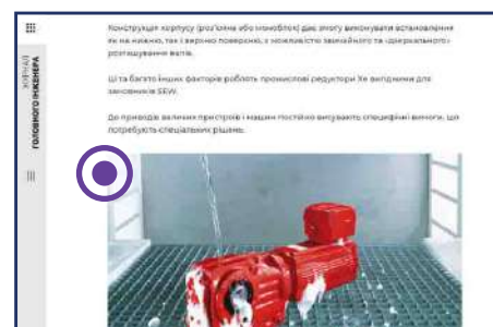
PR-стаття в кольорі