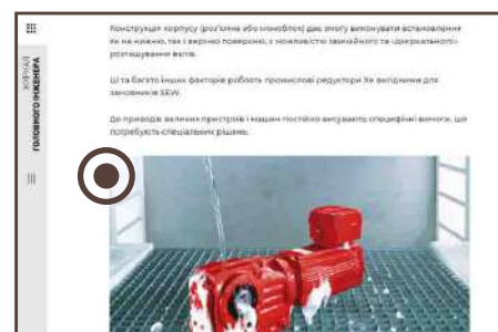
PR-стаття в кольорі