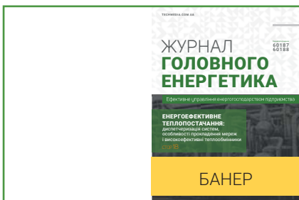
Банер на 1-й обкладинці