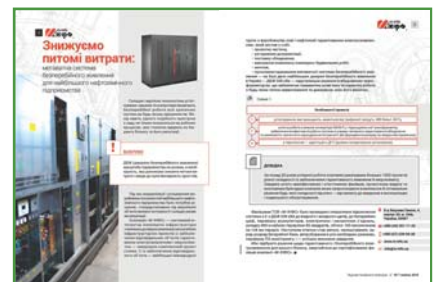
PR-матеріал на 2 шпальти (розворот)