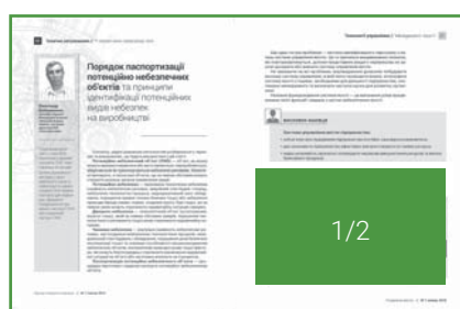
Внутрішні сторінки – 1/2 горизонталь