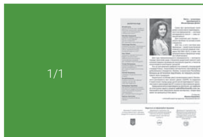
Шпальта на 2-й обкладинці