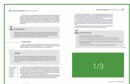
Внутрішні сторінки – 1/3 горизонталь