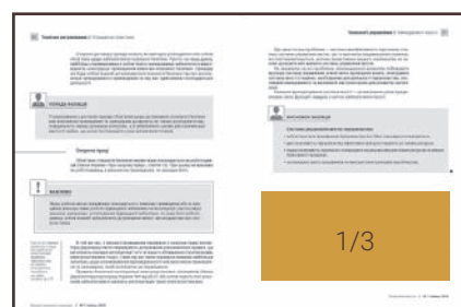
Внутрішні сторінки – 1/3 горизонталь