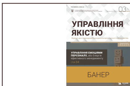
Банер на 1-й обкладинці