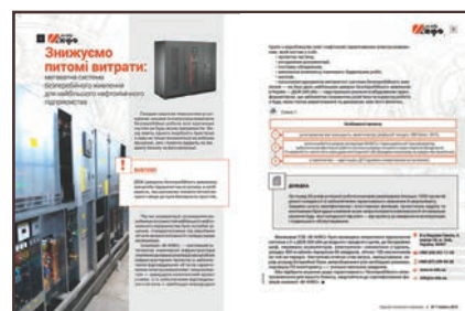
PR-матеріал на 2 шпальти (розворот)