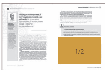
Внутрішні сторінки – 1/2 горизонталь