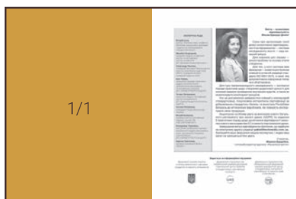
Шпальта на 2-й обкладинці