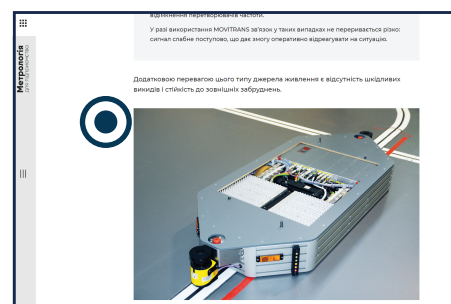
PR-стаття в кольорі